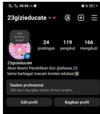
Gambar 2. Akun Instagram yang digunakan

Beberapa menu sarapan mingguan untuk mahasiswa yang diposting dalam program ini yaitu: