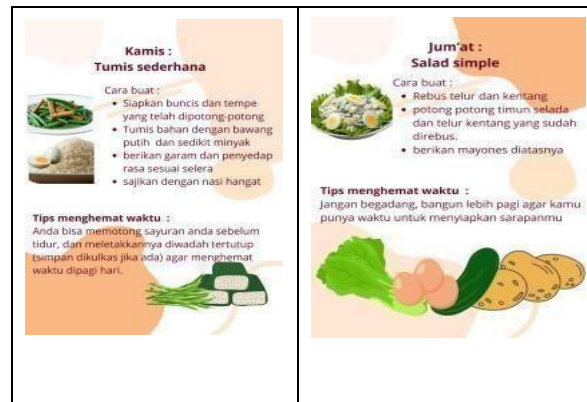
Gambar 3. Menu makanan simple dan sehat

Selain menu sarapan mingguan untuk mahasiswa, terdapat pula postingan video demonstrasi memasak menu sarapan dengan Pengambilan gambar yang baik, Pemilihan latar music yang sesuai, Narasi yang jelas dan mudah dipahami dan durasi yang tepat. Video tersebut meliputi pembukaan yang menarik, penampilan alat dan bahan, Langkah Langkah memasak dan presentasi akhir dengan informasi nutrisinya.