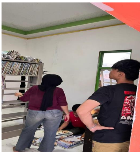
Gambar 2. Kegiatan Penataan Koleksi Buku Perpustakaan Desa

Gambar tersebut menunjukkan Mahasiswa KKN bersama karang taruna dan masyarakat melakukan pengecatan, pemasangan dekorasi, dan penataan ruang perpustakaan secara partisipatif. Tulisan “Literasi Negeri” dan “Perpustakaan Desa” dipasang sebagai simbol komitmen bersama dalam membangun budaya membaca. Kegiatan ini bertujuan menjadikan perpustakaan desa sebagai pusat informasi dan pembelajaran yang nyaman bagi masyarakat, Khususnya anak-anak dan pelajar.