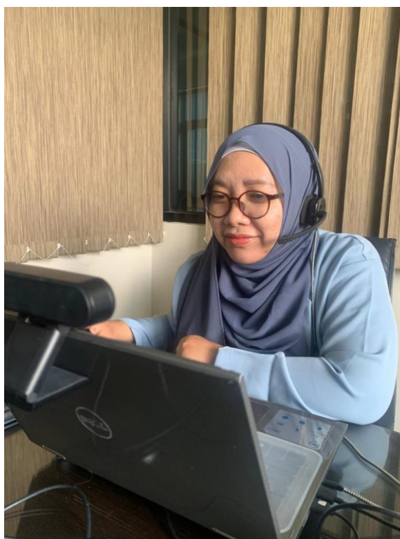
Gambar 2. Narasumber Memberikan Paparan tentang Materi Sosialisasi

Materi selanjutnya yakni tentang labor-based grading dimana tercantum tentang labor log yang dibuat dengan memanfaatkan penggunaan google sheet. Penggunaan labor log ini dimaksudkan guna mengukur capaian pembelajaran peserta didik dengan menjelaskan langkah demi langkah proses pembelajaran dengan melibatkan pemberian tugas yang harus dikerjakan oleh peserta didik juga mencerminkan refleksi diri peserta didik dari apa yang telah dikerjakannya. Pemateri memberikan model labor log yang telah dibuatnya dan telah dilaksanakan dalam proses pembelajaran yang diampunya. Pemateri juga menyampaikan refleksi peserta didiknya yang telah merasakan dampak dari penggunaan labor log dalam proses pembelajaran.