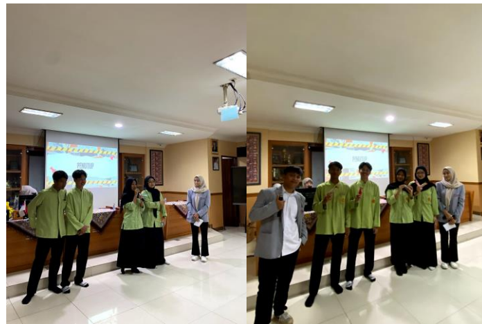
Gambar 10. Foto bersama dengan siswa/i yang memberikan Kesan dan Pesan