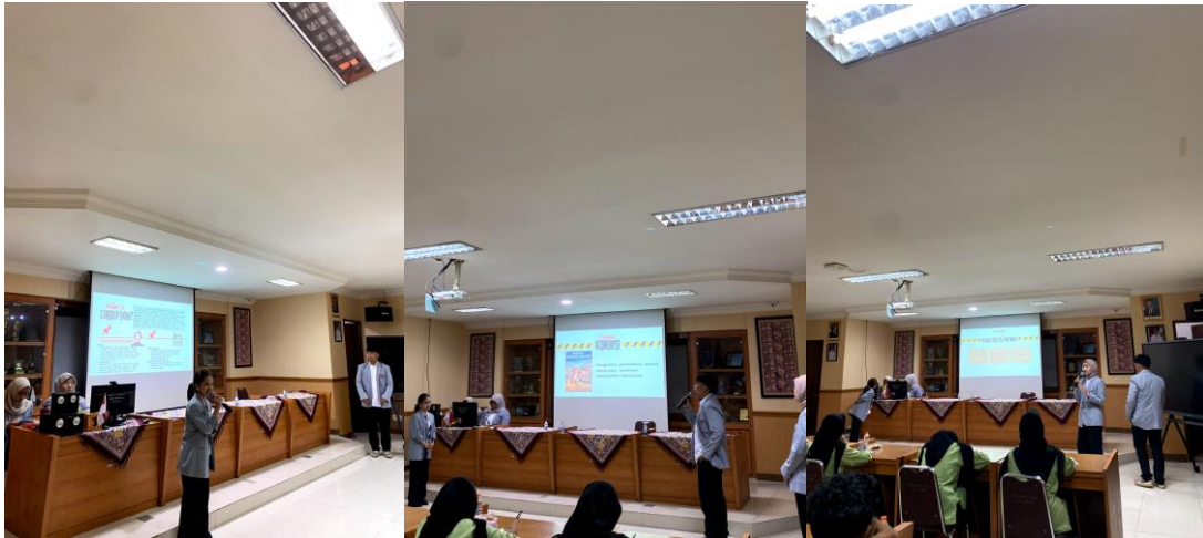
Gambar 6. Sesi Pemaparan Materi bersama Siswa/i SMKN 57 Jakarta