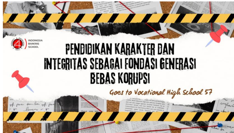
Gambar 3. Materi Presentasi Kegiatan Pengabdian Kepada Masyarakat