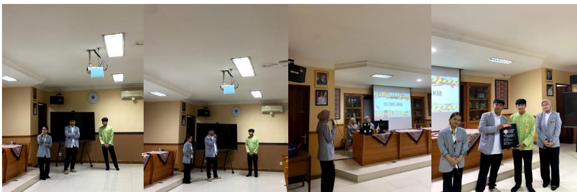
Gambar 8. Sesi Tanya Jawab dan Foto bersama Siswa/i SMKN 57 Jakarta