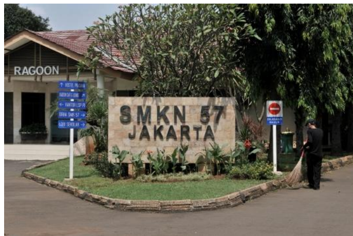
Gambar 2. SMKN 57 Jakarta

Kegiatan ini dilaksanakan di SMK Negeri 57 Jakarta yang berlokasi di Jalan Taman Margasatwa Raya No. 38B, RT.12/RW.5, Jati Padang, Pasar Minggu, Kota Jakarta Selatan, Daerah Khusus Ibukota Jakarta 12540. SMK Negeri 57 Jakarta merupakan sekolah menengah kejuruan negeri pertama di Indonesia yang bergerak di bidang pariwisata berdasarkan Keputusan Menteri Pendidikan dan Kebudayaan Nomor 036/0/1997. Pada awalnya, sekolah ini memiliki tiga program keahlian, yaitu Usaha Perjalanan Wisata, Akomodasi Perhotelan, dan Jasa Boga/Restoran. Seiring dengan perkembangan pendidikan dan kebutuhan industri, sejak tahun 2012, SMK Negeri 57 Jakarta menambah dua program keahlian baru, yaitu Seni Tari dan Seni