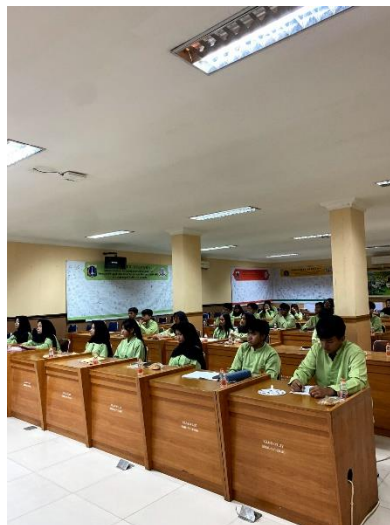
Gambar 5. Kelas 10 Jurusan Perhotelan SMKN 57 Jakarta