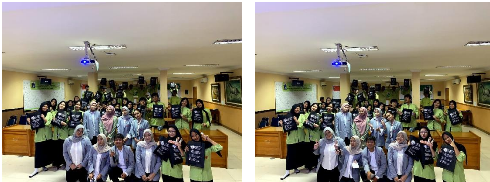
Gambar 4. Foto bersama Guru PKn dan Siswa/i SMKN 57 Jakarta