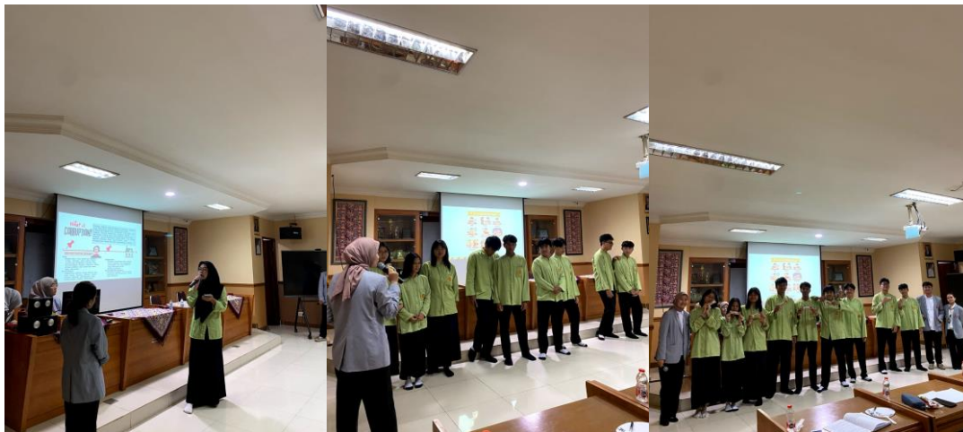
Gambar 7. Sesi interaktif Siswa/i berhasil menjawab pertanyaan dari panitia