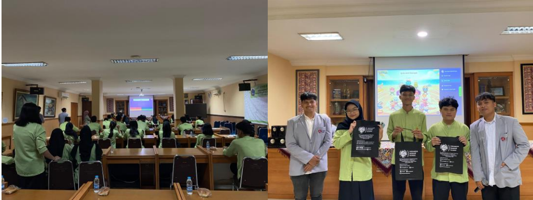
Gambar 9. Sesi Quiziz dan Foto bersama pemenang Quiziz