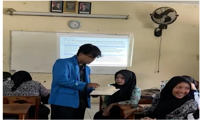
Gambar 2 Tim PKM memberikan pelatihan

Seluruh tahapan Kegiatan PKM ini dirancang untuk mengubah pola pembelajaran yang sebelumnya reseptif-teoretis menjadi pengalaman bersastra yang autentik dan berbasis produksi karya (Saragih et al., 2021). Perubahan sosial yang diharapkan mulai terlihat secara nyata sejak akhir hari pertama pelaksanaan. Terjadi pergeseran perilaku signifikan dari sikap pasif terhadap materi sastra menjadi antusiasme aktif dalam bereksperimen dengan bahasa. Ruang aman ( safe space ) yang sengaja diciptakan melalui pendampingan empatik dan kritik membangun berhasil mendekonstruksi stigma lama bahwa sastra adalah pelajaran yang membosankan dan tidak relevan.