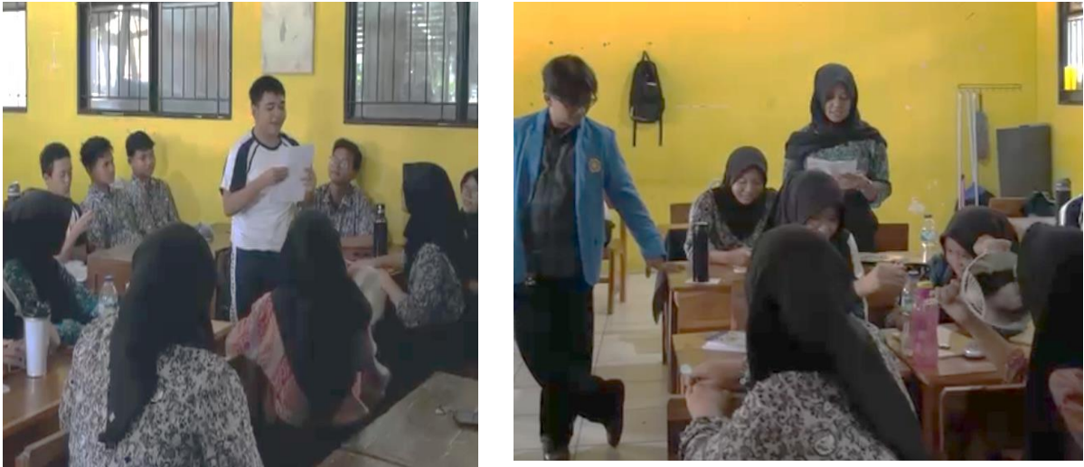
Gambar 4 Para peserta PKM antusias membacakan karya sastra yang telah dibuat

Siswa mulai memaknai sastra sebagai medium komunikasi, refleksi sosial, dan ekspresi identitas yang dekat dengan keseharian mereka di lingkungan urban Kota Tangerang. Fenomena ini memunculkan kesadaran baru bahwa keterampilan bersastra dapat bersinergi dengan kompetensi kejuruan DKV, khususnya dalam penguatan kreativitas visual dan naratif. Di sisi lain, dinamika kelompok selama praktik membaca karya di depan kelas memicu munculnya inisiatif kepemimpinan lokal ( local leader ) di antara peserta, yakni beberapa siswa secara sukarela menjadi moderator diskusi informal, memfasilitasi teman sekelompoknya dalam merevisi draf, dan memberikan apresiasi timbal balik. Dasar-dasar transformasi sosial ini juga diperkuat oleh konsistensi skor evaluasi, yakni 82,6% peserta menyatakan “ Puas ” hingga “ Sangat Puas ” dengan rata-rata kepuasan keseluruhan 4,32/5,00. Aspek kualitas pendampingan dan umpan balik memperoleh skor tertinggi (4,41), diikuti oleh kesadaran nilai budaya dan motivasi menulis berkelanjutan (4,33), serta relevansi materi (4,35). Capaian kuantitatif dan kualitatif ini mengonfirmasi bahwa intervensi kelas kreatif mengakibatkan munculnya perilaku kolektif, penguatan karakter, dan kesiapan ekosistem literasi yang partisipatif di lingkungan sekolah mitra.