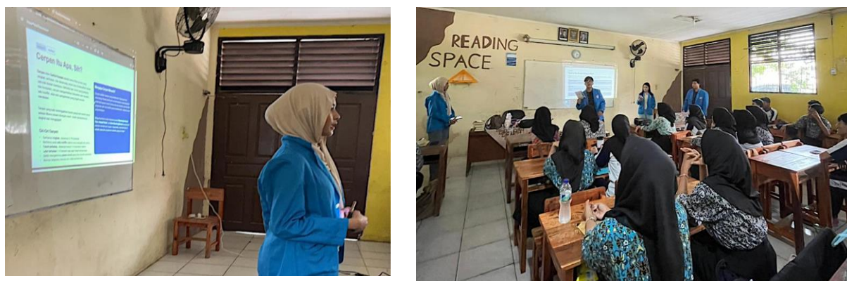
Gambar 1 Tim PKM memaparkan materi PKM

Kegiatan Pengabdian Kepada Masyarakat (PKM) bertajuk “Meningkatkan Apresiasi Sastra Melalui Kelas Kreatif Puisi dan Cerpen Bagi Siswa di SMK Negeri 5 Kota Tangerang” telah terlaksana secara penuh pada tanggal 23—24 April 2026 di SMK Negeri 5 Kota Tangerang, Kecamatan Pinang. Program ini melibatkan 31 siswa kelas X Program Keahlian Desain Komunikasi Visual (DKV) sebagai khalayak dampingan utama. Dinamika pendampingan dirancang secara sistematis melalui pendekatan partisipatif aktif yang mengintegrasikan empat ragam kegiatan utama, yakni (1) pemaparan konsep hakikat sastra dan karakteristik puisi/cerpen secara interaktif; (2) ice breaking bertema sastra untuk mencairkan suasana dan memicu imajinasi; (3) literacy workshop (bengkel sastra) yang menekankan proses kreatif bertahap mulai dari brainstorming, penulisan draf, presentasi karya; dan (4) pendampingan intensif dengan rasio mentor-peserta 1:3—1:4 yang memastikan setiap siswa memperoleh umpan balik personal dan konstruktif. Aksi teknis yang dilakukan meliputi penyusunan scaffolding penulisan, pelatihan pemilihan diksi dan majas untuk puisi, serta panduan struktur naratif (alur, tokoh, konflik, amanat) untuk cerpen.