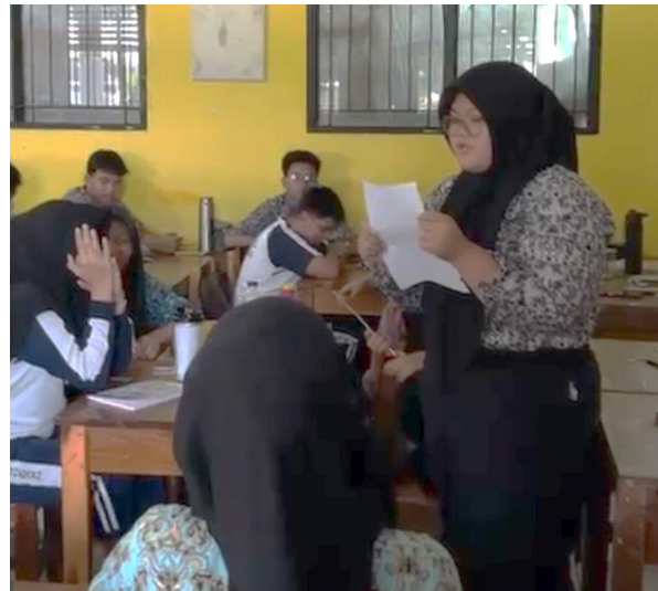
Gambar 3 Para peserta PKM antusias membacakan karya sastra yang telah dibuat