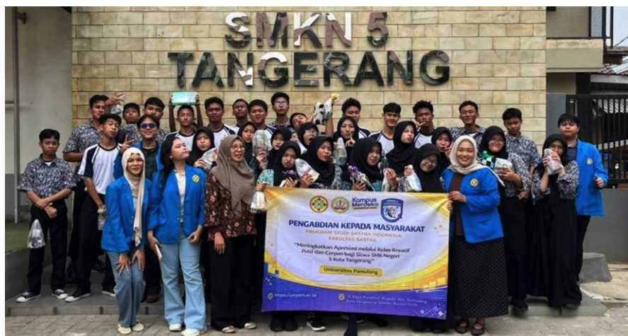
Gambar 5 Tim PKM bersama Mitra PKM

Siswa mulai memaknai sastra sebagai medium komunikasi, refleksi sosial, dan ekspresi identitas yang dekat dengan keseharian mereka di lingkungan urban Kota Tangerang. Fenomena ini memunculkan kesadaran baru bahwa keterampilan bersastra dapat bersinergi dengan kompetensi kejuruan DKV, khususnya dalam penguatan kreativitas visual dan naratif. Di sisi lain, dinamika kelompok selama praktik membaca karya di depan kelas memicu munculnya inisiatif kepemimpinan lokal ( local leader ) di antara peserta, yakni beberapa siswa secara sukarela menjadi moderator diskusi informal, memfasilitasi teman sekelompoknya dalam merevisi draf, dan memberikan apresiasi timbal balik. Dasar-dasar transformasi sosial ini juga diperkuat oleh konsistensi skor evaluasi, yakni 82,6% peserta menyatakan “ Puas ” hingga “ Sangat Puas ” dengan rata-rata kepuasan keseluruhan 4,32/5,00. Aspek kualitas pendampingan dan umpan balik memperoleh skor tertinggi (4,41), diikuti oleh kesadaran nilai budaya dan motivasi menulis berkelanjutan (4,33), serta relevansi materi (4,35). Capaian kuantitatif dan kualitatif ini mengonfirmasi bahwa intervensi kelas kreatif mengakibatkan munculnya perilaku kolektif, penguatan karakter, dan kesiapan ekosistem literasi yang partisipatif di lingkungan sekolah mitra.