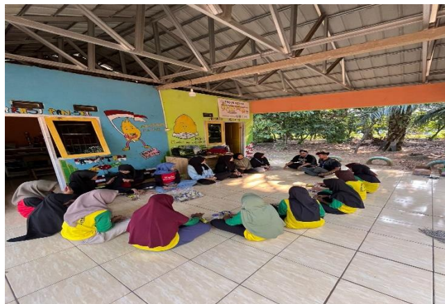
Gambar 4 Pemberian materi