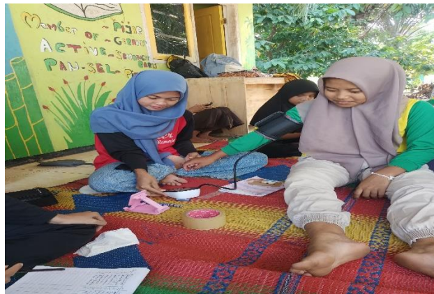
Gambar 3 Pemeriksaan remaja