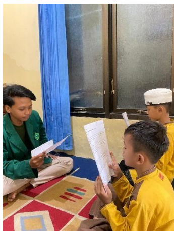
Gambar 1: Menampilkan suasana awal pendampingan praktik khutbah Jumat

Terlihat peserta dan pendamping dalam tahap awal kegiatan. Pendamping memberikan penjelasan tentang struktur khutbah, teknik berbicara, dan materi dakwah yang akan dipraktikkan. Kegiatan pembekalan awal seperti ini penting untuk membangun fondasi pemahaman peserta tentang tujuan latihan serta meningkatkan kesiapan mental sebelum praktik berbicara di depan umum (Nurhayati & Nugraha, 2020). Hal ini menunjukkan bahwa persiapan awal memegang peran penting dalam kesiapan peserta untuk melakukan praktik khutbah yang efektif.