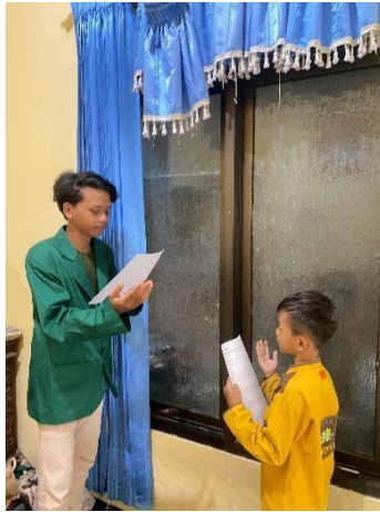
Gambar 2: Memperlihatkan salah satu peserta sedang berdiri di depan untuk mempraktikkan khutbah

Menunjukkan seorang peserta yang berdiri dan mencoba menyampaikan khutbah di depan pendamping atau rekan lainnya. Latihan seperti ini mencerminkan pendekatan learning-by-doing , di mana peserta belajar melalui praktik langsung yang berulang. Metode pembelajaran berbasis praktik terbukti efektif dalam meningkatkan keterampilan komunikasi dan kepercayaan diri dalam konteks pembelajaran masyarakat (Setiawati et al., 2024). Dengan demikian, praktik langsung membantu peserta mengasah keterampilan publik berbicara yang diperlukan dalam dakwah khutbah Jumat.