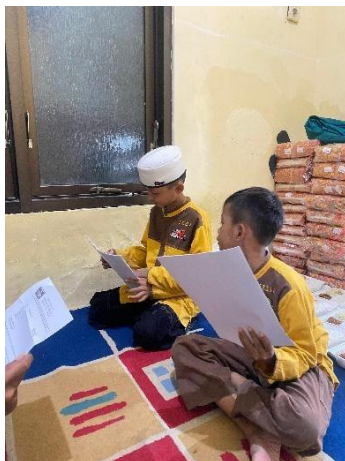
Gambar 4. Memperlihatkan peserta yang sedang membaca dan memahami teks khutbah bersama pendamping

mereka dengan standar keberhasilan yang diharapkan (Subekti, 2023). Hal ini menunjukkan bahwa evaluasi langsung dapat memperbaiki aspek teknis penyampaian khutbah secara sistematis.