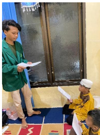
Gambar 5. Menampilkan suasana kebersamaan antara pendamping dan peserta setelah sesi Latihan

Menunjukkan suasana kebersamaan setelah sesi latihan selesai. Momen seperti ini memperkuat hubungan sosial antara peserta dan pendamping serta menciptakan iklim pembelajaran yang suportif. Penelitian menunjukkan bahwa unsur dukungan sosial sangat membantu pembentukan rasa percaya diri dan motivasi belajar ketika masyarakat terlibat dalam kegiatan bersama (Hidayat, Sari & Maulana, 2020). Dengan demikian, suasana kebersamaan berkontribusi pada semangat dan keterlibatan peserta dalam proses pembelajaran dakwah.