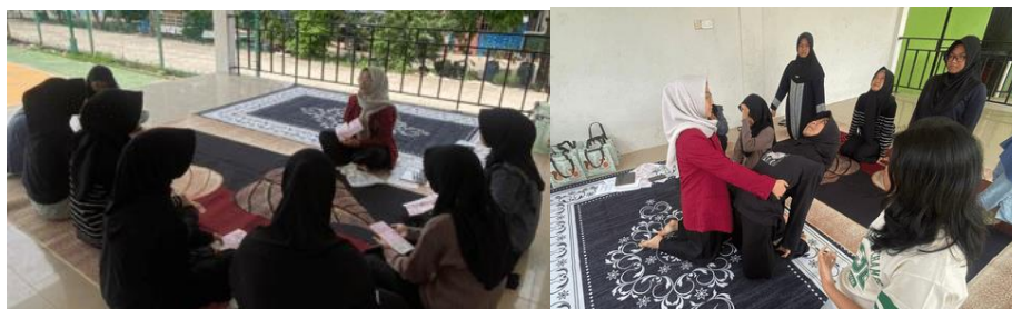
Gambar 4. Dokumentasi edukasi & demonstrasi

Dengan meningkatnya pemahaman responden, diharapkan remaja putri dapat lebih memahami kondisi nyeri haid yang dialami serta mengetahui cara penanganan yang tepat untuk mengurangi ketidaknyamanan saat menstruasi.