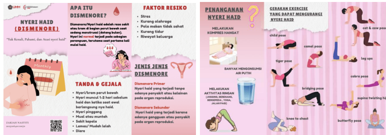
Gambar 2. leaflet