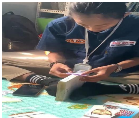
Gambar 2. Melabel buku dengan label berwarna sesuai kategori koleksi