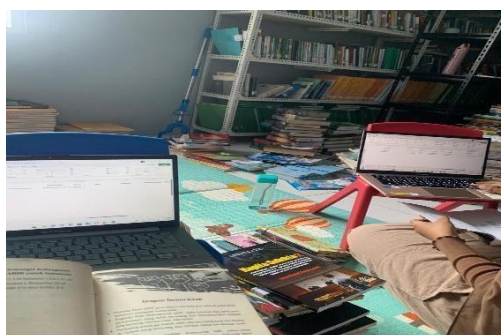
Gambar 1. Menginput buku di Slims Perpustakaan STAI AL-AZHAR GOWA

Program ini bisa terlihat dari hasil penataan ruang perpustakaan di STAI AL-AZHAR GOWA. Penataan ruang perpustakaan menunjukkan perubahan yang positif setelah dilaksanakan kegiatan PKL. Tata letak ruangan menjadi lebih rapi dan teratur dengan pengaturan ulang posisi rak buku, meja baca, dan area layanan. Sirkulasi ruang menjadi lebih lancar sehingga memudahkan pergerakan pemustaka di dalam perpustakaan. Selain itu, kebersihan dan kerapian ruang perpustakaan meningkat, menciptakan suasana yang lebih nyaman dan kondusif untuk kegiatan membaca dan belajar. Selain penataan tata ruang hasil dari pelaksanaan PKL ialah penataan dan revisi koleksi buku menunjukkan adanya peningkatan kerapian dan ketepatan penempatan koleksi. Buku-buku yang sebelumnya tidak sesuai dengan nomor klasifikasi telah diperbaiki dan disusun kembali berdasarkan urutan yang benar. Selain itu, kondisi fisik buku diperiksa sehingga buku yang rusak ringan dapat diidentifikasi untuk dilakukan perbaikan, sedangkan buku yang tidak layak pakai dipisahkan. Penataan ini mempermudah proses temu kembali informasi dan meningkatkan kualitas layanan perpustakaan.