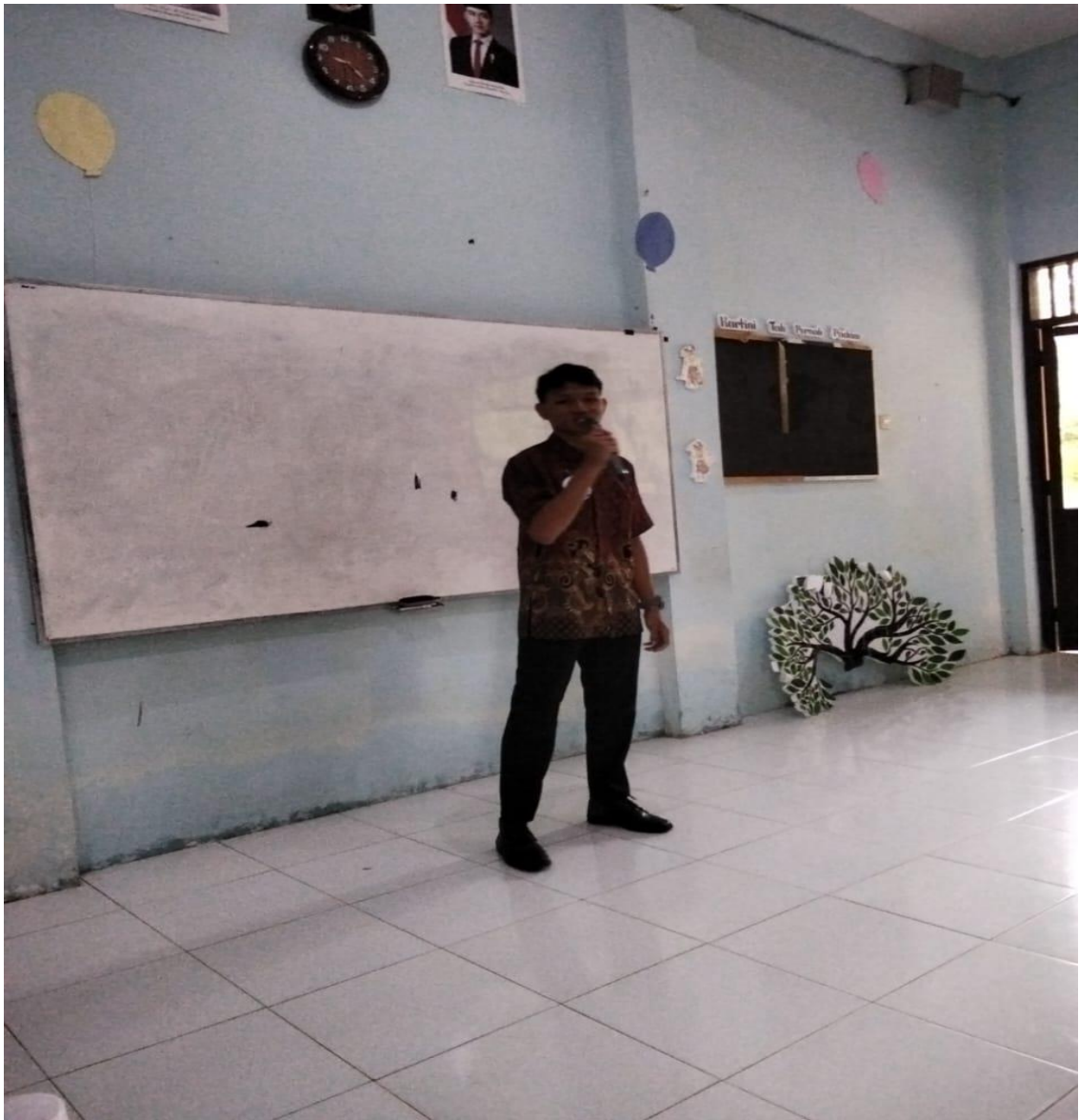
Gambar 2. Simulasi pidato oleh salah satu peserta pelatihan di hadapan teman-temannya.