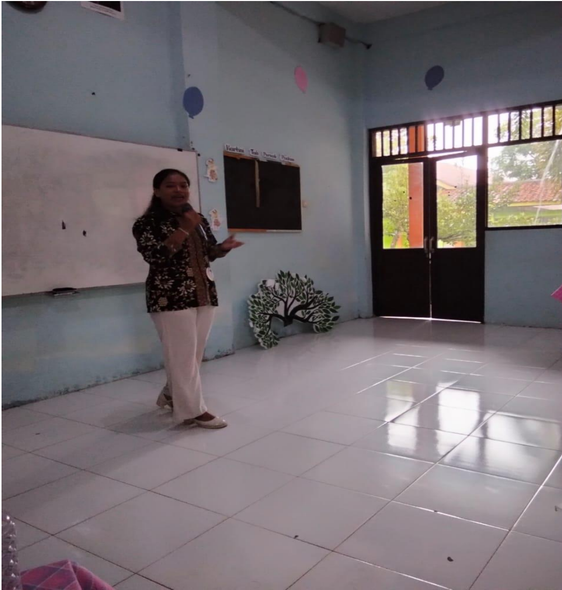
Gambar 3. Simulasi pidato oleh salah satu peserta pelatihan di hadapan teman-temannya.