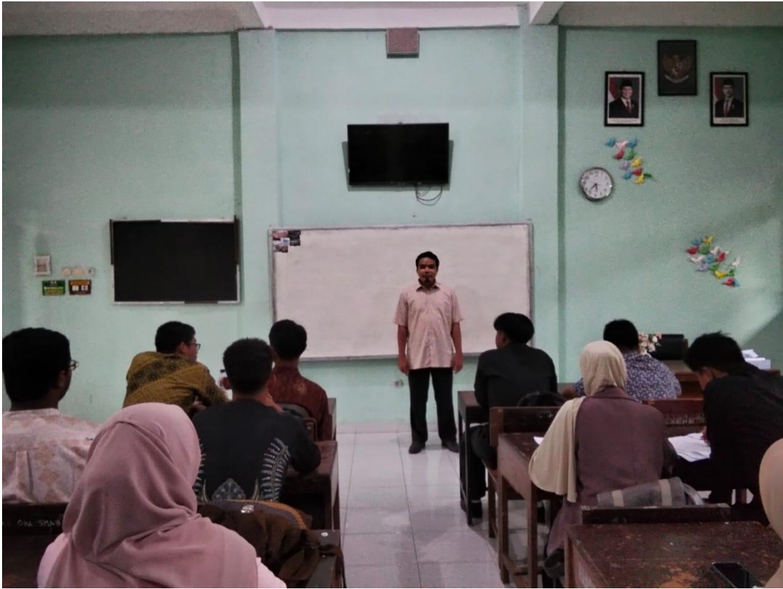
Gambar 1. Fasilitator sedang memberikan materi